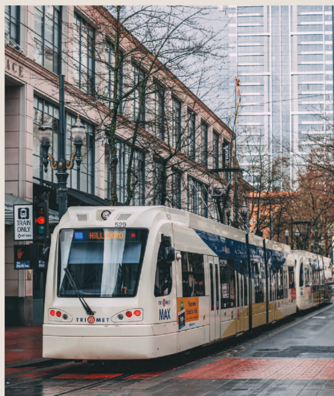
TRANSIT INFORMATION trimet.org